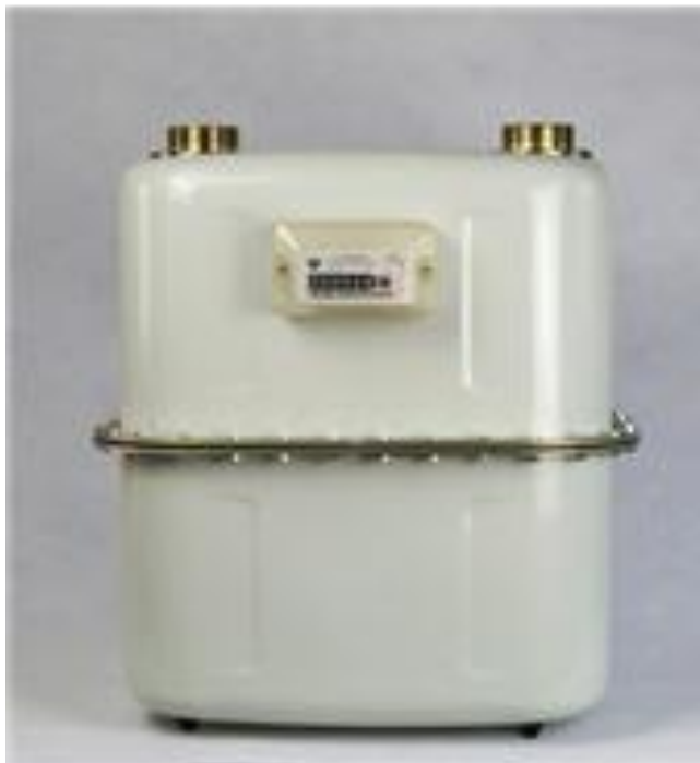
Рисунок 1 – Общий вид счетчика

Общий вид счетчиков СГДК представлен на рисунке 1.